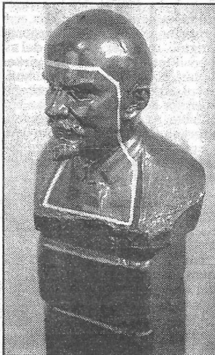
Kommunismen som teologi - Lenin i Madonna-mundur.

Kloster-seminaristen fra Georgia var som kjent regissøren bak teologiseringen av Lenins minne, som bl.a. ble grunnlaget for en hel industri for alt fra byster i pianopynt-format til kolossalstatuer. Det er denne kommunistiske kitsch-produksjo-